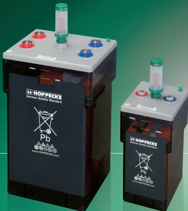
Abbildungen ähnlich, AquaGen® optional