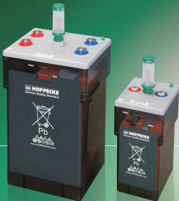
Similar to the illustration, AquaGen® optional